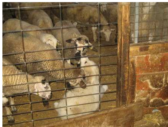
Engorgs de Ca l'Ainat

21-03-2015. Nace la primera camada de MPRs en el rebaño de "Ous Ecològics de l'Empordà" del Mas Rimbau a Cabanes en la comarca de l'Alt Empordà (Catalunya). Los padres son Artic de la Canova y Baserca de Cal Fontestà. Nacieron un macho y una hembra que se entregaron a los ganaderos siguientes: